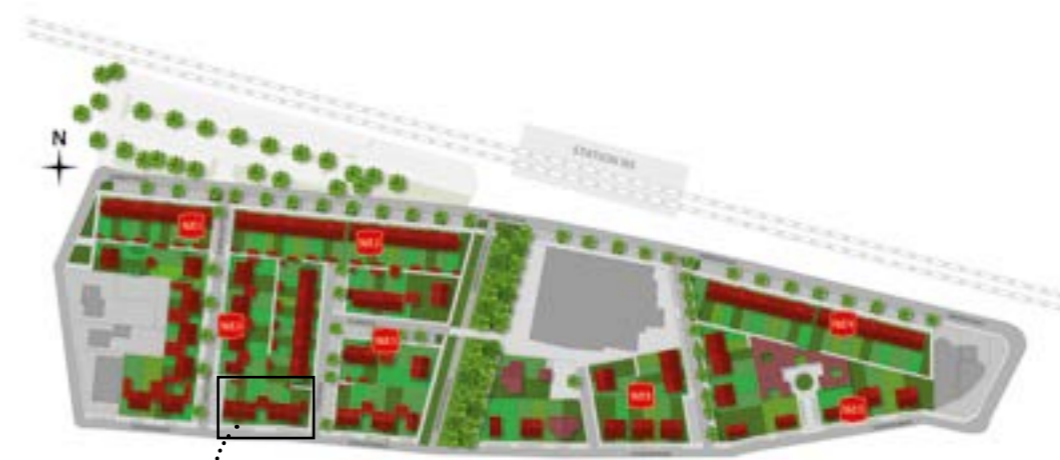
6 RIJ- EN HOEKWONINGEN

Aan de Steenovenweg komen 6 eengezinswoningen van 5,4 meter breed. Onderverdeeld in twee korte blokken van drie woningen. De variatie in gevelkleuren zorgen voor een gevarieerd beeld dat aansluit op de rest van de wijk.